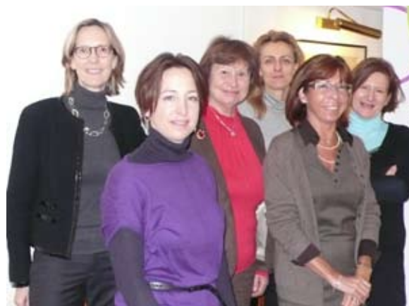
le jury du grand oral